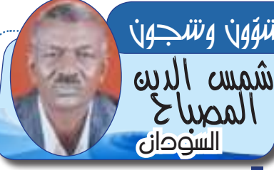
شمس الصباح المصباح السودان